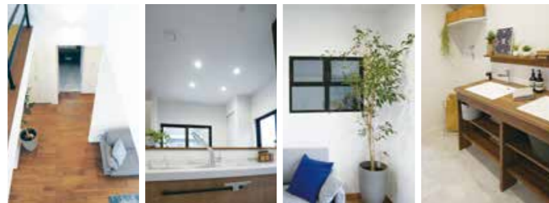
※三次市東酒屋町完成見学会外観&室内写真(令和3年3月撮影)。外観写真の周辺環境は省略し、外構・植栽はCG加工を施しています。